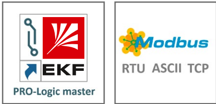
Бесплатная среда программирования Интерфейсы RS-485 и Ethernet